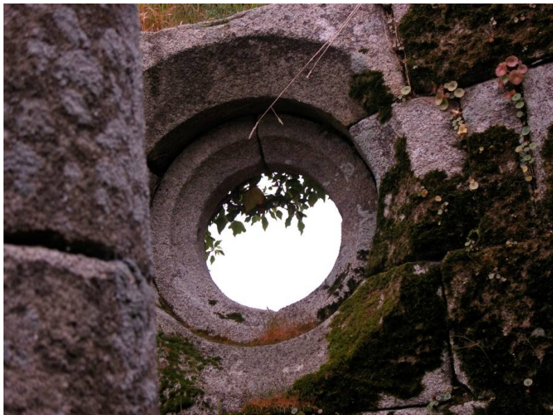
Photo prise à l'intérieur de la tour du manoir de Saint-Alouarn